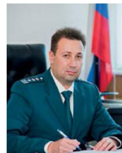
«Онлайн-кассы сделают прозрачнее бизнес. Тем самым они создадут дополнительные трудности тем, кто пытается использовать «серые» схемы оплаты труда.»

Неплохо, но это только капля в море и верхушка айсберга. Сегодня законодатель вместе с IT-специалистами работают над совершенствованием системы, упрощением регистрации и платежей, более детальным учетом всех нюансов. Разрабатываются мобильные приложения, которые позволяют фиксировать продажи, формируют чеки для продавца и покупателя, передают данные в ФНС и оплачивают соответствующий налог с каждой